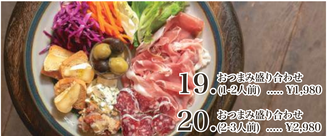
19. おつまみ盛り合わせ (1-2人前) ..... ¥1,980