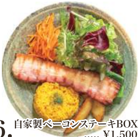
6. 自家製ベーコンステーキBOX ..... ¥1,500