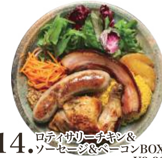
14. ロティサリーチキン& ソーセージ&ベーコンBOX ..... ¥3,300