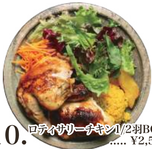
10. ロティサリーチキン1/2羽BOX ..... ¥2,500