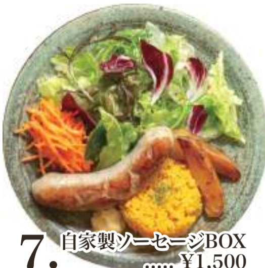
7. 自家製ソーセージBOX ..... ¥1,500