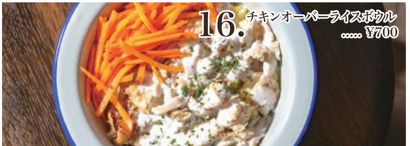
16. チキンオーバーライスボウル ..... ¥700