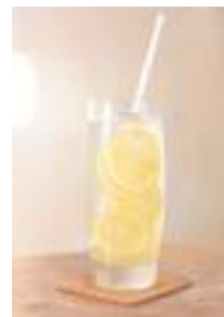
34. 自家製爽やか レモンスカッシュ