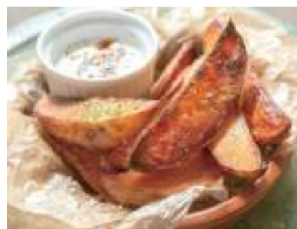
23. チキンの旨みしみしみ ローストポテト (写真はピリ辛ヨーグルトソース付)