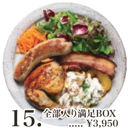
15. 全部入り満足BOX ..... ¥3,950