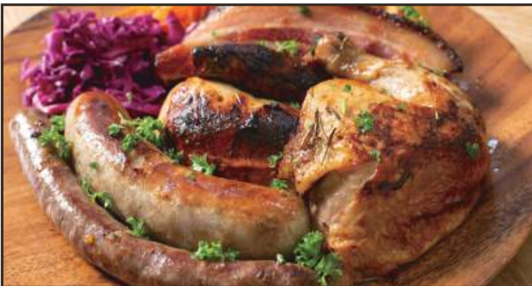
21. メイン料理盛り合わせ 3-4人前 ..... ¥5,980

(内容) ロティサリーチキン2人前 自家製ソーセージ2種 自家製ベーコン ローストポテト キャロットラペ 紫キャベツのマリネ