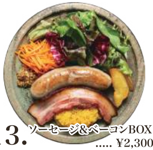
13. ソーセージ&ベーコンBOX ..... ¥2,300