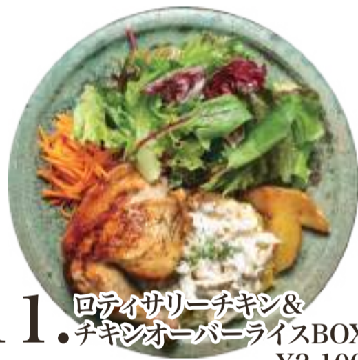
11. ロティサリーチキン& チキンオーバーライスBOX ..... ¥2,100