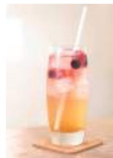
35. ベリー入り フレーバーソーダ