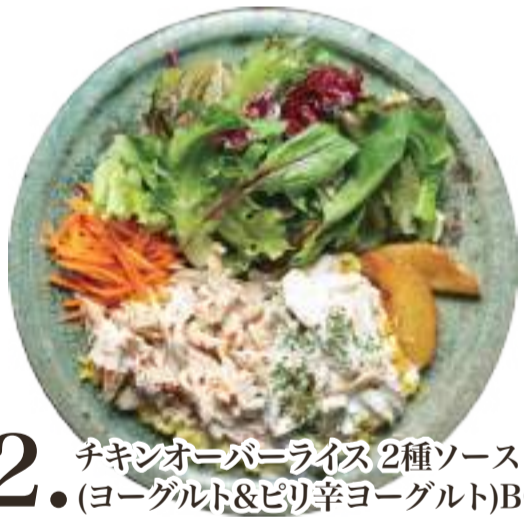
12. チキンオーバーライス 2種ソース (ヨーグルト&ピリ辛ヨーグルト)BOX ..... ¥1,400