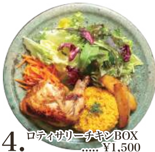
4. ロティサリーチキンBOX ..... ¥1,500