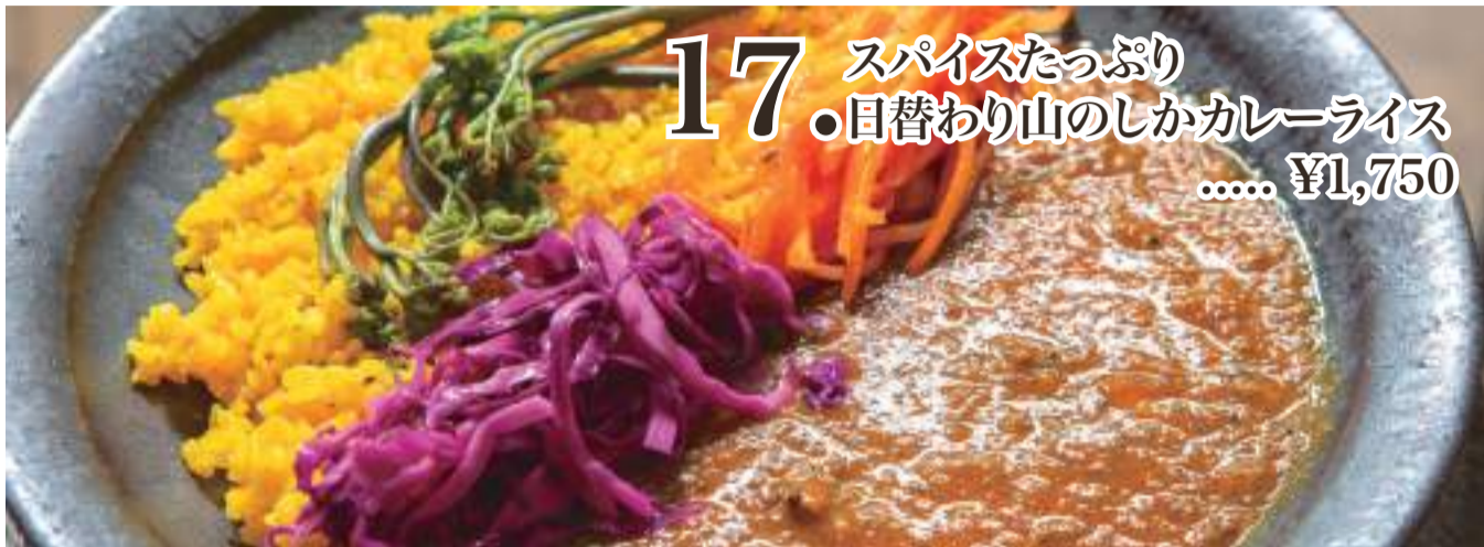
17. スパイスたっぷり 目替わり山のしかカレーライス ..... ¥1,750