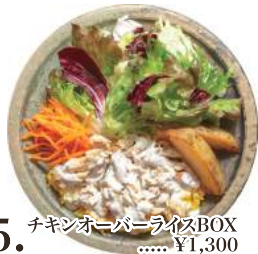
5. チキンオーバーライスBOX ..... ¥1,300