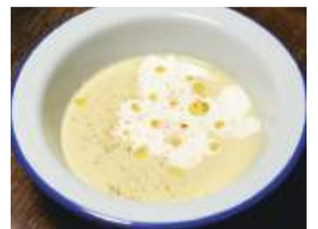
26. お野菜たっぷり きょうのスープ