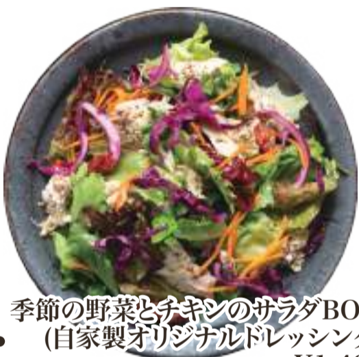
9. 季節の野菜とチキンのサラダBOX (自家製オリジナルドレッシング) ..... ¥1,400