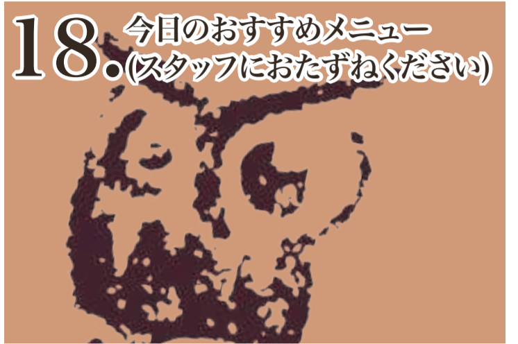
18. 今日のおすすめメニュー (スタッフにおたずねください)