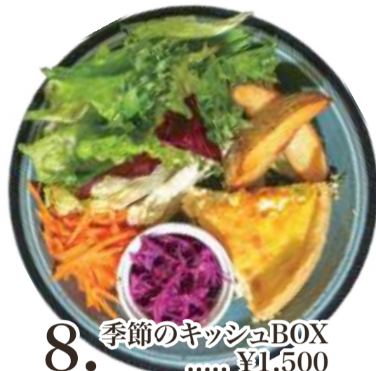
8. 季節のキッシュBOX ..... ¥1,500